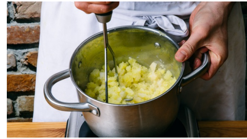
2. Puree maken

Schil de knolselderij en aardappels en snijd beiden in blokjes van 1cm. Pel de knoflook en snijd in plakjes. Boen de champignons schoon en snijd in dunne plakjes.