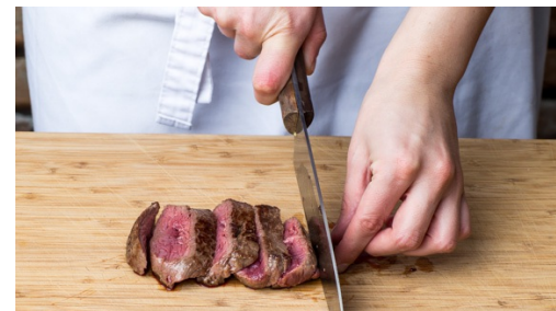
5. Biefstuk snijden

Neem intussen de biefstuk uit de verpakking en dep deze droog. Bestrooi met zout en peper. Verhit 2el olie in een grote koekenpan op hoog vuur. Laat de olie tot het rookpunt komen. Leg de biefstuk voorzichtig in de pan. Draai de biefstuk gedurende 4min elke 15 seconden om (dus 15 keer in totaal).