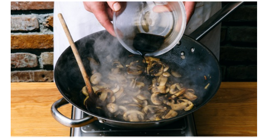
3. Champignons bakken

Doe de knolselderij en aardappels in een middelgrote kookpan en vul met water tot de groenten net onderstaan. Voeg 1tl zout en het laurierblad toe. Kook de groenten in ca. 10min beetgaar. Giet af, verwijder het laurierblad en stamp tot een gladde puree . Breng op smaak met zout en peper.