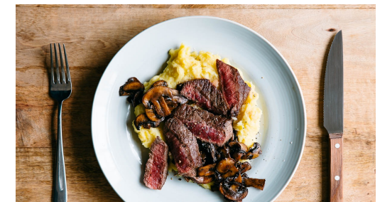
6. Gerech serveren

Laat de biefstuk daarna ca. 5min op een bord rusten. Snijd het vlees tegen de draad schuin in plakken.