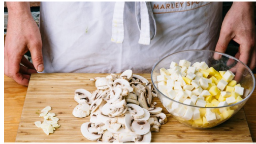
1. Groenten snijden

calorieën 575.0kcal, vet 21.8g, eiwit 43.9g, koolhydraten 43.3g