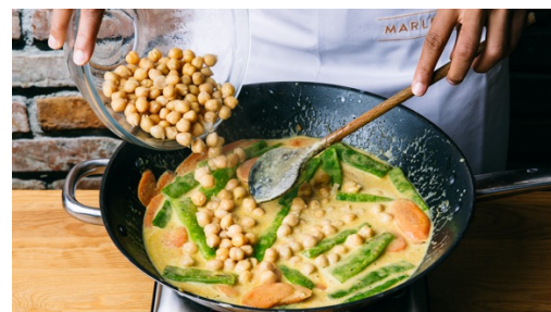
5. Curry mischen

Währenddessen die Karotten schälen und schräg in dünne Scheiben schneiden. Die Enden der Bohnen abschneiden und die Bohnen dritteln. Die Kichererbsen in einem Sieb gut abtropfen lassen.