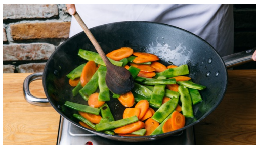
4. Gemüse anschwitzen

In einem mittelgroßen Topf 800ml leicht gesalzenes Wasser zum Kochen bringen. Den Reis in einem Sieb unter fließendem Wasser abspülen, bis das Wasser klar bleibt. Sobald das Wasser kocht, den Reis bei niedrigster Hitze abgedeckt ca. 10-12Min. kochen, bis das Wasser komplett aufgesogen und der Reis gar ist. Noch ca. 5Min. ohne Hitze abgedeckt ziehen lassen.