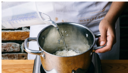
1. Reis kochen

Kalorien 865.0kcal, Fett 37.5g, Eiweiß 21.8g, Kohlenhydrate 103.6g