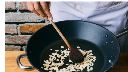
3. Mandeln anrösten

Nun je nach Schärfewunsch die Korma-Currypaste sowie die gesamte Kokosmilch hinzufügen und auf niedriger Hitze 4-5Min. leicht köcheln lassen. Nach Geschmack mit Salz und Pfeffer abschmecken, dann die Kichererbsen untermischen.