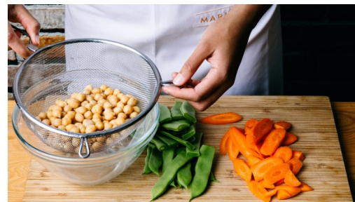
2. Gemüse vorbereiten

In derselben Pfanne 1-2EL Pflanzenöl auf mittlere Hitze erwärmen und die Karotten mit den geschnittenen Bohnen ca. 4-6Min. anbraten.