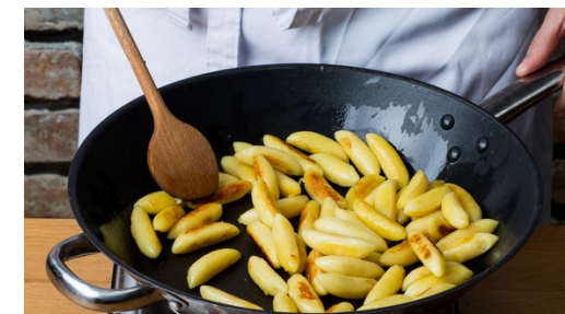
3. Schupfnudeln braten

Den Brokkoli im kochenden Wasser ca. 2Min. vorkochen, dann in ein Sieb abgießen und mit kaltem Wasser abschrecken. Wer das Gemüse lieber etwas weicher mag, kocht den Brokkoli für weitere ca. 1-2Min.