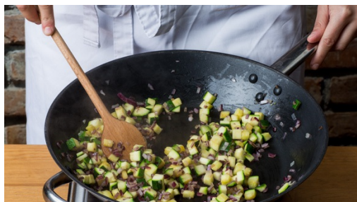
4. Zucchini braten

Eine große Pfanne mit 1-2EL Öl hoch erhitzen und die Schupfnudeln darin gleichmäßig goldbraun anbraten. Aus der Pfanne nehmen und warm halten. In mehreren Durchgängen arbeiten, sodass nie zu viele Schupfnudeln in der Pfanne sind und sie gleichmäßig bräunen können.