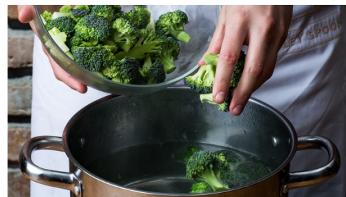
2. Brokkoli vorkochen

Einen mittleren Topf mit ausreichend gesalzenem Wasser für den Brokkoli zum Kochen bringen. Brokkoli in mundgerechte Röschen schneiden, den Strunk schälen und in 1cm Würfel schneiden. Zwiebeln schälen und fein hacken.