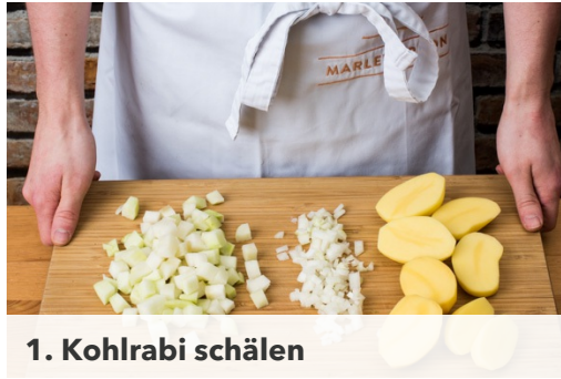
1. Kohlrabi schälen

Kalorien 860.0kcal, Fett 48.3g, Eiweiß 42.3g, Kohlenhydrate 57.5g