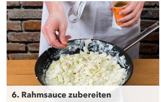
6. Rahmsauce zubereiten

Die Bouletten nun in der Pfanne mit 1-2EL Pflanzenöl auf mittlerer Hitze von jeder Seite ca. 4-5Min. braten. Sobald die Bouletten durch sind, aus der Pfanne nehmen, warm halten. Die Hitze runter stellen und die Pfanne auswischen.