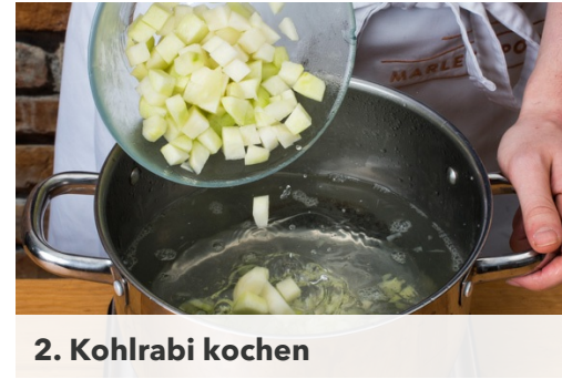
2. Kohlrabi kochen

In einem großen Topf ausreichend Wasser für den Kohlrabi und die Kartoffeln aufsetzen. Den Kohlrabi schälen und in ca. 1cm große Würfel schneiden. Die Zwiebel schälen, halbieren und in sehr feine Würfel schneiden, die Kartoffeln schälen und je nach Größe halbieren oder vierteln.