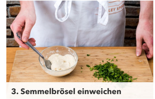
3. Semmelbrösel einweichen

Sobald das Wasser kocht, den Kohlrabi für ca. 4-5Min. bissfest kochen, aus dem Wasser nehmen und zur Seite stellen. Anschließend das Wasser salzen und die Kartoffeln im gleichen Topf je nach Größe für ca. 15-20Min. gar kochen, dann abgießen.