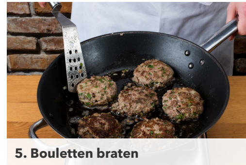
5. Bouletten braten

Nun das Hackfleisch mit den Zwiebeln , der Petersilie und den Semmelbrösel vermengen. Mit Salz, Pfeffer, Senf und 1 Prise Muskat abschmecken, dann das Ei untermischen. Dann ca. 6 gleich große Kugeln formen und etwas platt drücken.