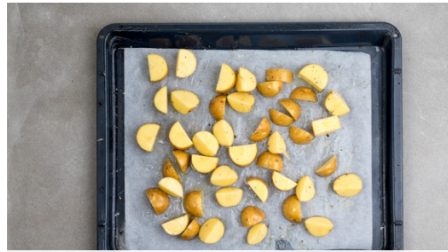
1. Aardappels bakken

calorieën 755.0kcal, vet 40.1g, eiwit 25.4g, koolhydraten 57.3g