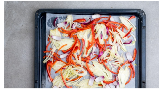
2. Groenten bakken

Verkruimel de kaas . Doe de kaas met de peterselie, cashewnoten, rest van de knoflook , 2-3el olijfolie, 1-2tl azijn (liefst appel of witte wijn), 1-2el water, een snuf peper en zout in een hoge (maat)beker. Pureer met een staafmixer tot een gladde pesto . Proef en breng evt. op smaak met meer peper, zout, azijn en/of suiker.