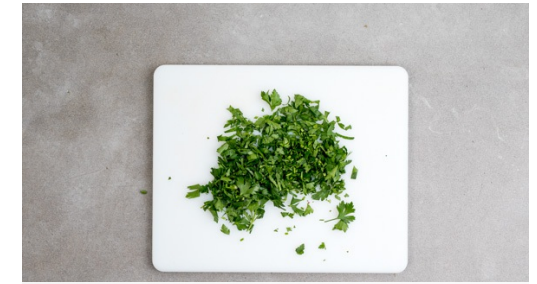
3. Peterselie hakken

Snijd de rookworsten eerst in de lengte en dan in de breedte doormidden. Verhit een grote koekenpan of grillpan op middelhoog vuur en bak de rookworsten ca. 3min per zijde tot ze warm en goudbruin zijn.